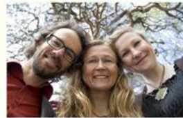
Arctic Warriors Oy