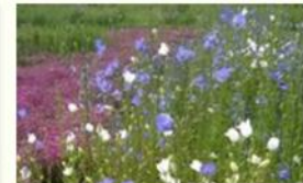
Suomen Niittysiemen Oy