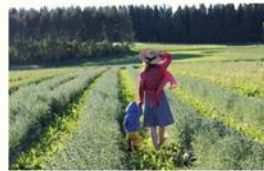
Frantsilan Luomuyrttiä Ky