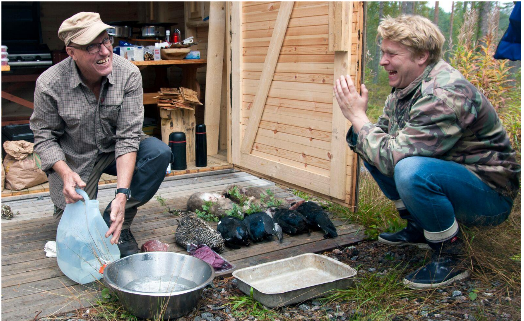
Suomalaista villiruokaa a´la Maulavirta ja Tallberg – ELO-säätiön villiruokakoulutus