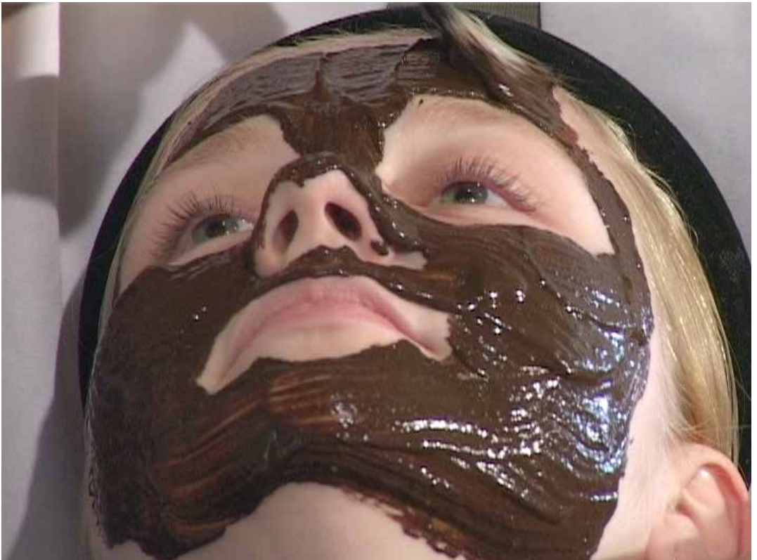
Kuva 3. Kylpy- ja hoitoturvealalla Etelä-Pohjanmaalla on vahvaa osaamista ja pioneeriyrittäjyyttä.