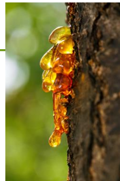
Erikoistuotteet (mm. terva, mahla, pettu, pihka ja turve)