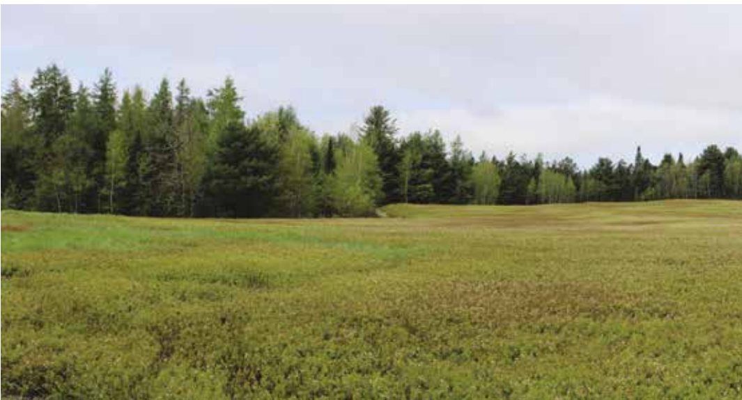
Kuva 4. Pohjois-Amerikassa marjantuotantoa on laajennettu viljelyn avulla. Kuvan kanadanmustikkakenttä Mainessa on perustettu metsänpohjan luontaisesta kasvustosta. Toistaiseksi viljellyt marjat ovat pitkälti kilpailleet samoilla maailmanmarkkinoilla metsämarjojen kanssa.